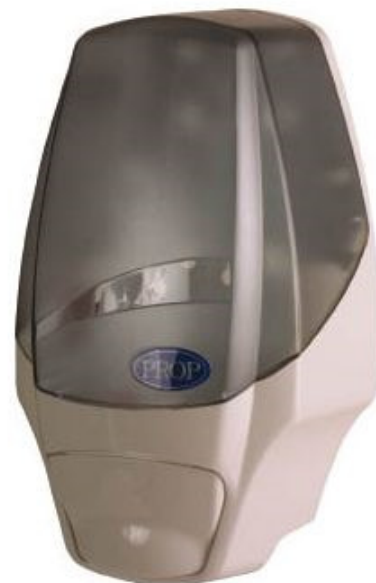
immagine a scopo illustrativo e non vincolante

Le pompe sono brevettate antigoccia e garantiscono la pulizia dell'ambiente intorno all'apparecchio.